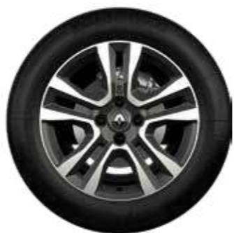
rin de aluminio Jogger 16" diamantado