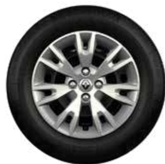
embellecedor Eptius 15"