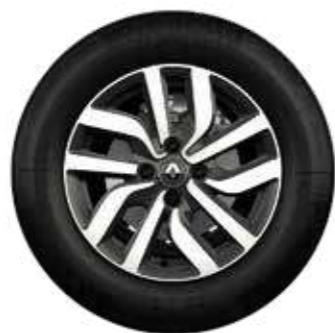
rin de aluminio Premia 15" diamantado